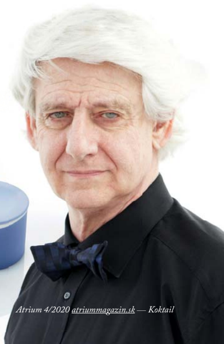
Atrium 4/2020 atriummagazin.sk — Cocktail